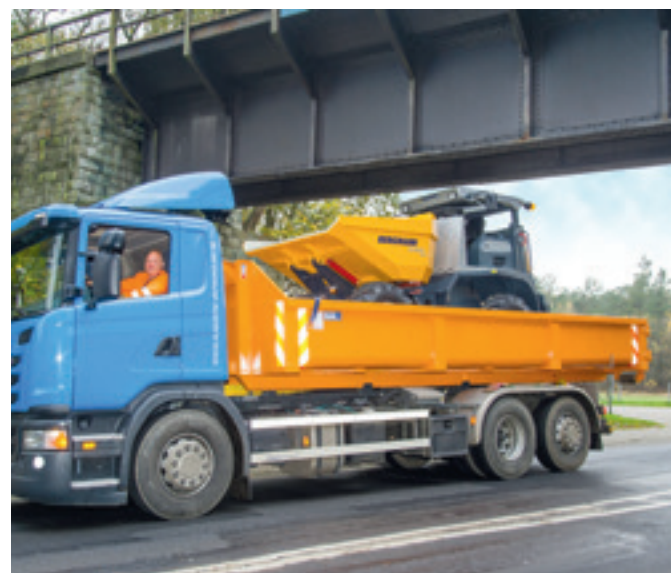
2060 plus Rundkipper