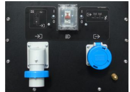
Panel de control estándar

La carrocería de la nueva Linktower T3 ha sido diseñada para ofrecer una mejor protección ante la lluvia al panel de control.