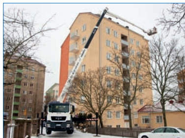
S 50 XDT-J bietet 16 Meter Über- und Hinterfahrbereich.