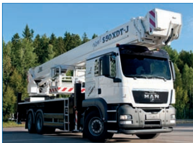
S 50 XDT-J montiert auf MAN TGS 26.400 6x2/4 Fahrgestell.

All dies in Verbindung mit einer unglaublichen Vielfalt an Bronto XDT Sonderausstattungen, zum Beispiel des 1300 kg Windträgers oder einem 360-Grad-TV-Kamera-Korb. Als Steuerung wird das praxisbewährte Bronto+ System eingesetzt - das in allen Bronto Geräten übliche System. Legendar für präzisen, feinfühligem Betrieb und seine Daten-Fernkalibrierung.