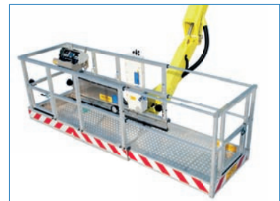
Hydraulisch verbreiterbarer Korb (600 kg) als Option erhältlich.